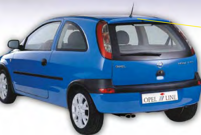
Dachspoiler Roof spoiler

Kunde: Irmischer Opel Corsa-L SMC-Verfahren, Oberfläche Class "A"